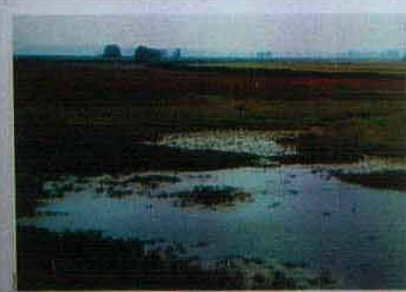
Auenwälder an der Dannenberger Marsch