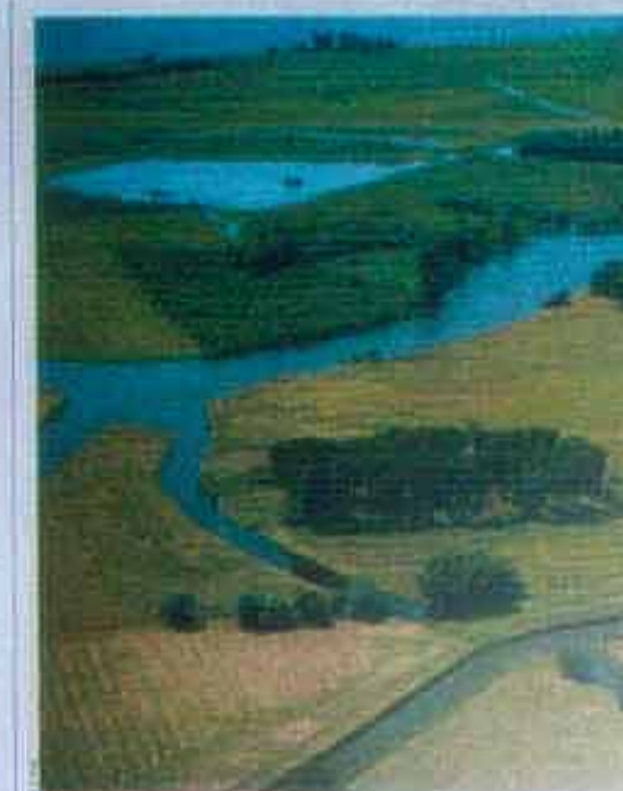
Naturschutzgebiet (NSG) »Haseldorfer Binnenelbe mit Elbvordland«.

Der Bund fördert seit 1979 mit dem Programm »Naturerschutzzorhaben mit gesamtstaatlich repräsentativer Bedeutung« Naturschutzmaßnahmen in besonders typischen, großflächigen, naturnahen Gebieten, die Lebensräume gefährdeter oder vom Aussterben bedrohter Arten umfassen. Die Fördermittel werden überwiegend für den Flächenankauf oder die langfristige Pacht von gefährdeten Flächen sowie für die Durchführung von ersten Pflege- und Entwicklungsmaßnahmen und z.T. auch für die Erarbeitung von Planungsunterlagen bereitgestellt.