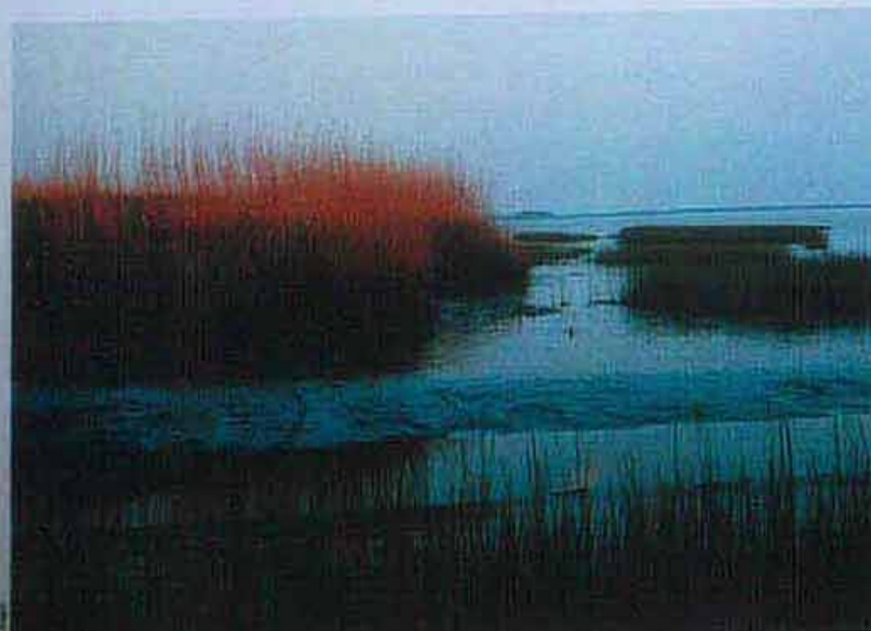
Freshwater mud flats at the lower course of the Elbe (Haseldorf marsh lands).