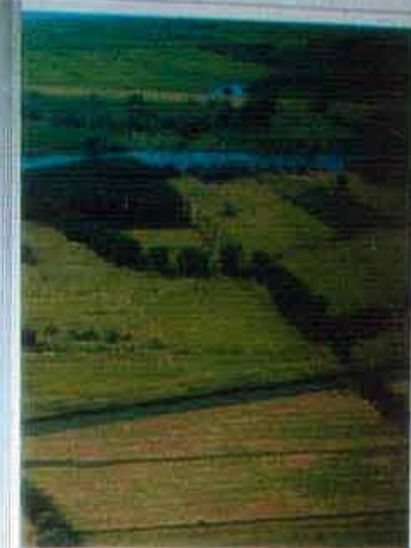
Naturschutzgebiet (NSG) »Haseldorfer Binnenelbe mit Elbvordland«.

From the Giant Mountains along the river Elbe to the North Sea a great number of protected areas have been designated which are subject to different degrees of protection. This means that more than half of the Elbe river banks are under protection on one or both sides.