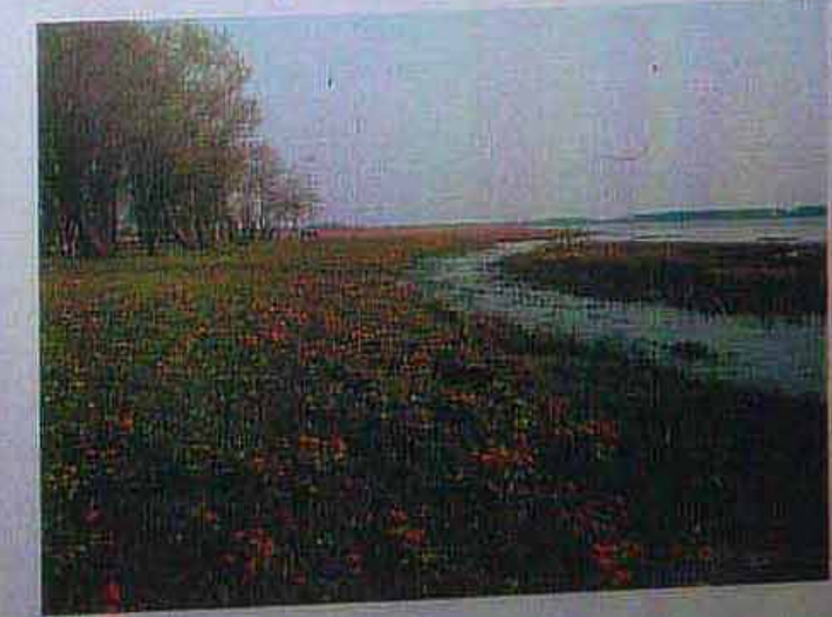
Sumpfdotterblumen-Wiese am Rande des Elbwattes. A meadow of Marsh Marrygolds bordering the Elbe flats.