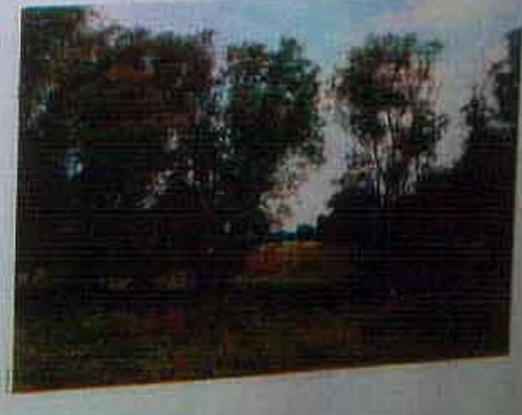
Auenwälder an der Dannenberger Marsch