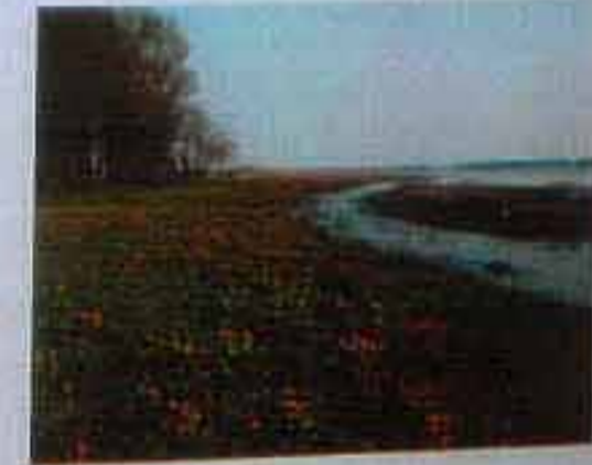
Naturschutzgebiet (NSG) »Haseldorfer Binnenelbe mit Elbvordland«.