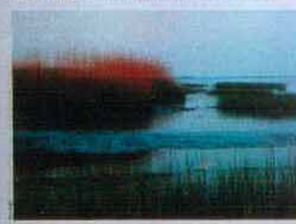
Süßwasserwatt an der Unteren Elbe (Haseldorfer Marsch)